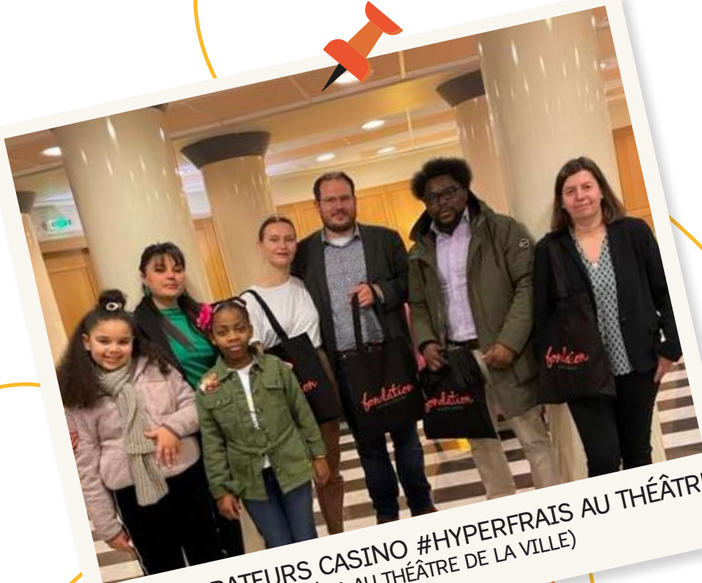
COLLABORATEURS CASINO #HYPERFRAIS AU THÉÂTRE (MASSÉNA AU THÉÂTRE DE LA VILLE)