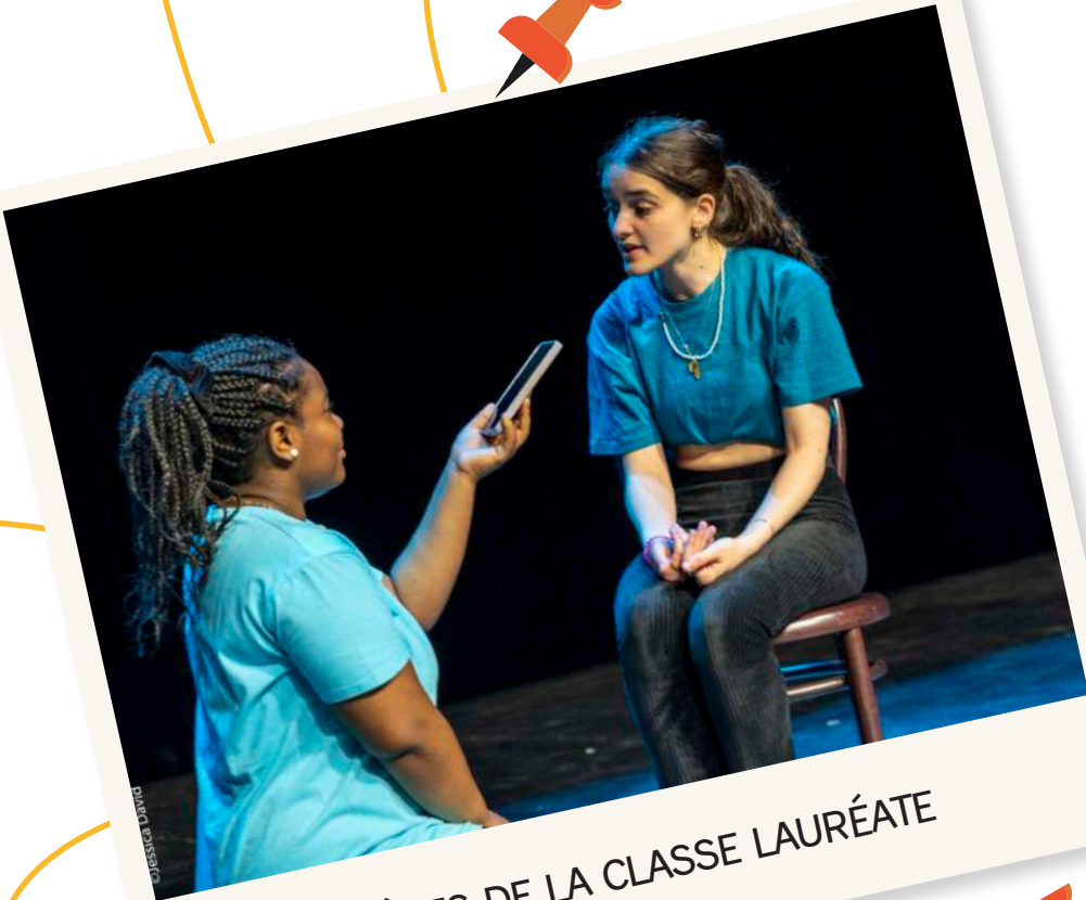
ÉLÈVES DE LA CLASSE LAURÉATE