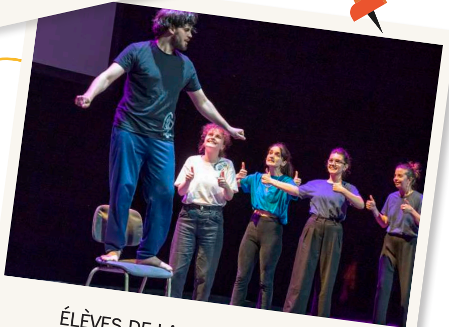
ÉLÈVES DE LA CLASSE LAURÉATE