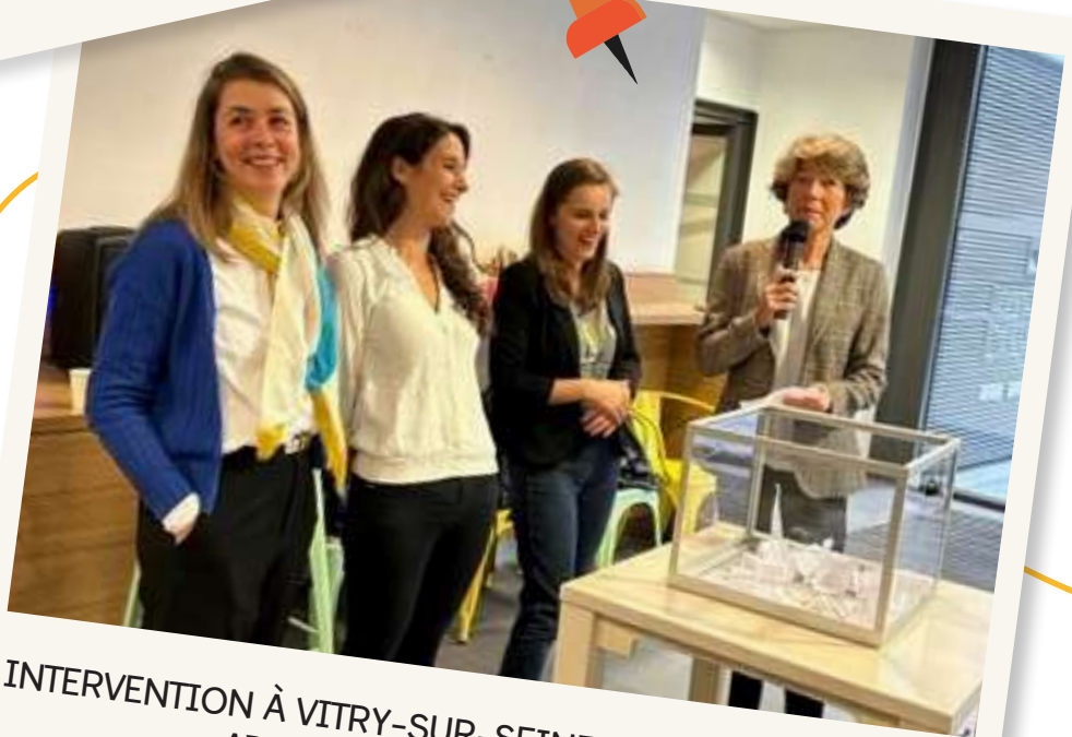
INTERVENTION À VITRY-SUR-SEINE DE NOS PARTENAIRES APPRENTIS D'AUTEUIL ET L'ENVOL